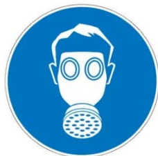
Носете предпазна маска

По време на смяната на филтъра може да се разпръсне нездравословен прах. Следователно потребителят трябва да носи защитни очила, защитни ръкавици и предпазна маска, отговарящи на клас на защита FFP3.