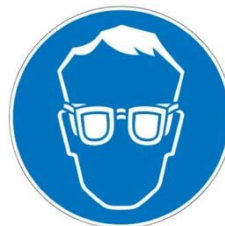
Носете защитни очила